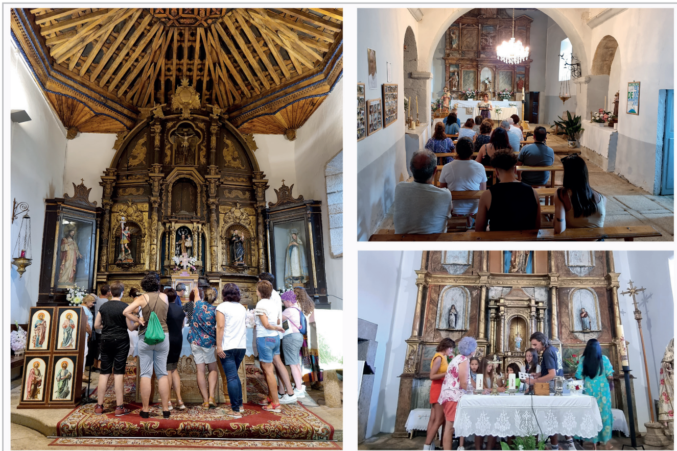
Figura 8.- Desarrollo de una charla-taller sobre retablos en los pueblos de Trabazos, Tolilla y Lober en agosto de 2022.