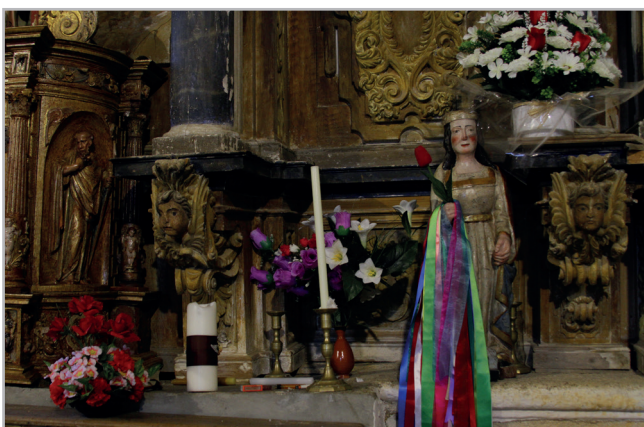
Figura 7.- Objetos para el ornato y la celebración de la misa, distribuidos en el altar y algunas zonas del retablo mayor de la Asunción de la iglesia parroquial de Flores de Aliste

En lo que respecta a la colocación de velas, luminarias, adornos florales o textiles [Figura 7], las medidas que puede llevar a cabo la población local pasarán por la modificación de dichas prácticas de manera que haya un consenso entre lo más adecuado para el retablo desde el punto de vista de la conservación y lo que considere cada parroquia que está dispuesta a admitir. De nuevo, la concienciación sobre las repercusiones que pueden tener algunas de estas acciones será muy importante en este proceso. Como explica Domínguez (2018: 387-391), existe cierta confusión en la ubicación de algunos de estos elementos, puesto que tradicionalmente se han dispuesto sobre el altar, pero al escindir-se después del Concilio Vaticano II se han continuado colocando tanto en el altar principal como en el de los retablos. Al igual que la Iglesia, que se muestra a favor de la moderación en el ornato (Vaticano 2007), consideramos innecesario el abuso que en ocasiones se hace de estos elementos.