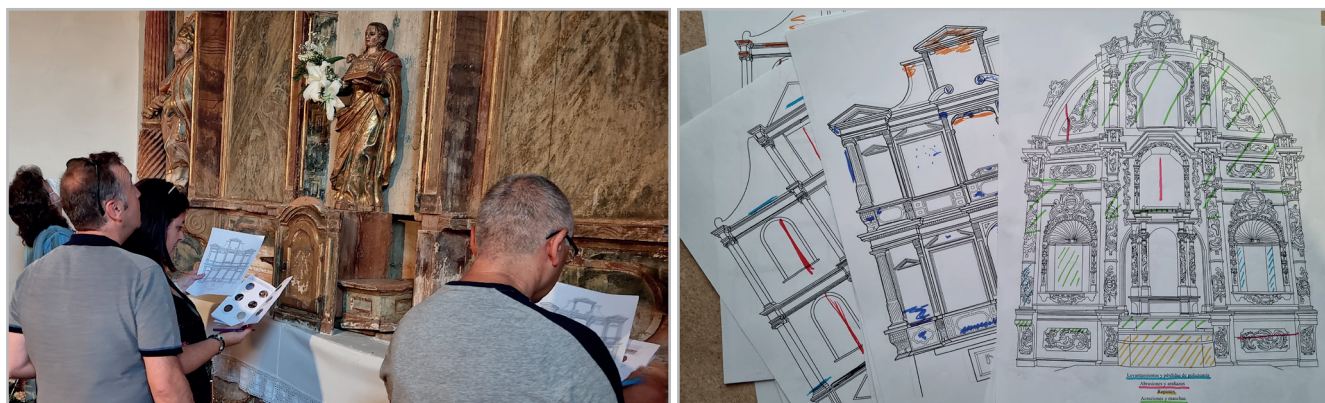
Figura 9.- Participación del público con la realización de un mapa de daños y algunos resultados

También hemos observado, a través de un seguimiento periódico posterior, resultados prometedores en cuanto a la conservación de bienes culturales. Se han conseguido modificar algunas prácticas que estaban siendo perjudiciales o podían poner en riesgo la integridad de los retablos, como es la colocación de flores de plástico en lugar de flores naturales y la sustitución de velas de cera por velas a baterías. Asimismo, se han impulsado intervenciones de conservación-restauración de esculturas y retablos (Herrera 2024), además del arreglo del tejado en uno de los templos donde las goteras incidían directamente sobre el retablo. Este último era un trámite que llevaba años intentándose, viéndose en la actividad y en reuniones