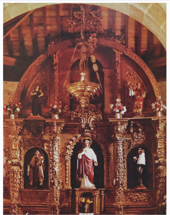
Figura 3.- Retablo mayor de la Magdalena de la iglesia parroquial de Grisuela de Aliste, donde puede verse el cambio de ubicación de las esculturas entre la disposición actual (a la izquierda) y la de los años 90 con la inclusión de tablas en el ático (a la derecha, fotografía obtenida de Rodríguez Fernández, G. (1999). Los pueblos de Aliste . Zamora: Gregorio Fernández Rodríguez).