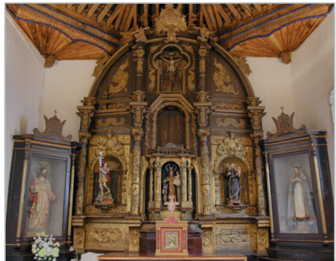
Figura 2.- Retablo mayor de San Pelayo de la iglesia parroquial de Trabazos de Aliste, en el que los vecinos retiraron el repinte marrón en la mitad inferior, con el riesgo que conlleva para la obra y para ellos mismos al no ser una actuación llevada a cabo por profesionales.

criterios de conservación-restauración. Una de las más frecuentes son los repintes (Domínguez 2018: 695-699), que localizamos en numerosos retablos de nuestra área de estudio, desde repintes parciales para disimular un daño puntual hasta aquellos que cubren la totalidad de su superficie. En este caso pueden obedecer a una pérdida prácticamente completa de la policromía original o a una distorsión de los colores originales por la oxidación del barniz y la presencia de suciedad adherida, por lo que en ocasiones se conserva la policromía original bajo la pintura del repinte [Figura 2]. No faltan otras cuestiones como modas o arrebatos de creatividad, según las explicaciones de los vecinos. Con un deseo de protección, encontramos también la aplicación de gruesas capas de barniz, diferentes sustancias para prevenir el ataque de insectos xilófagos y, aunque afortunadamente sólo de forma sugerida, la aplicación de pintura para subsanar la acción de la carcoma.