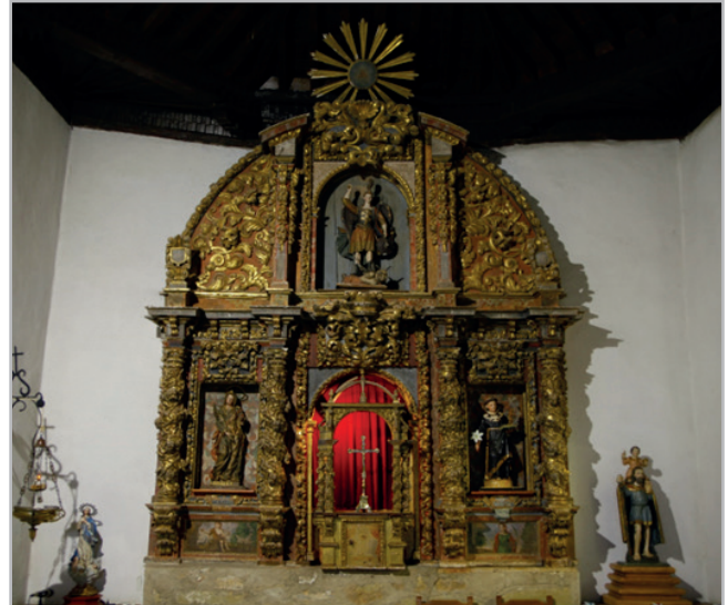
Figura 4.- Retablo mayor de San Cristóbal de la iglesia parroquial de San Cristóbal de Aliste, donde han sustituido por un San Miguel el lugar en el ático que le correspondía al santo titular, hoy colocado a la derecha del altar por ser un sitio más accesible.

Otro grupo de necesidades son las relacionadas con el uso del espacio. En cuanto a la iluminación, en algunas iglesias el cableado de la instalación eléctrica pasa por el retablo, tanto de manera visible como intentando ocultarlo por la parte posterior. En nuestra zona de estudio, la electricidad llegó hacia los años 60 del siglo XX, momento en el que se hicieron cambios para la iluminación de los retablos, sustituyendo en ocasiones a las velas de cera y lámparas de aceite. Algunos de estos sistemas se fueron retirando