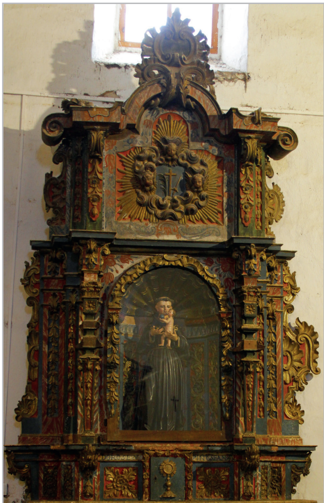
Figura 5.- Retablo de San Antonio de la iglesia parroquial de Sejas de Aliste, en el que instalaron una vitrina para mayor protección del santo.

más consciente sus recursos, empleándolos en aquellas actuaciones en las que sea verdaderamente prioritario invertir y siendo coherentes con lo que realmente necesitan y esperan conseguir.