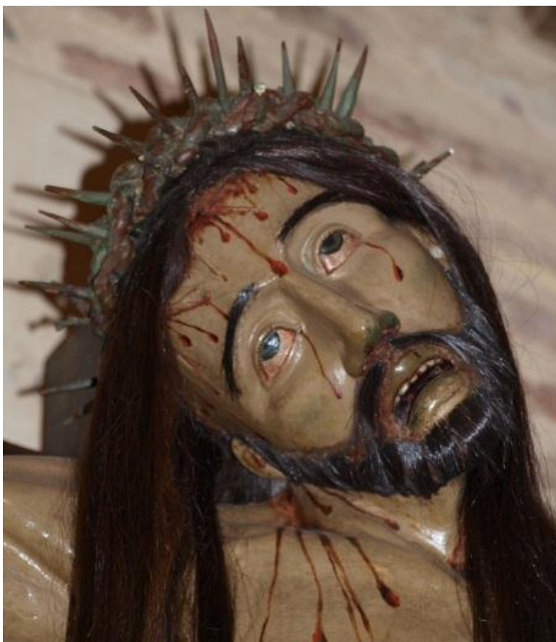
Figura 9. Detalle de la cabeza del Cristo de la Agonía. Se aprecia el empleo de cabello natural en las cejas, barba y cabellera.

La tela encolada lleva implícito el efecto del tiempo detenido, de la perpetuación de un instante a causa del encolado. Las telas en las prendas reales están sometidas a continuos movimientos y transformaciones en formas, pliegues y volúmenes, por efecto de la gravedad, tipo de fibra, hilatura, ligamento, peso y grosor del tejido que las conforman. En cambio, la tela encolada consigue fijar esas formas como en una instantánea volumétrica, y ya no se verá afectada en su forma aunque se mueva, o manipule, o por influencia del entorno.