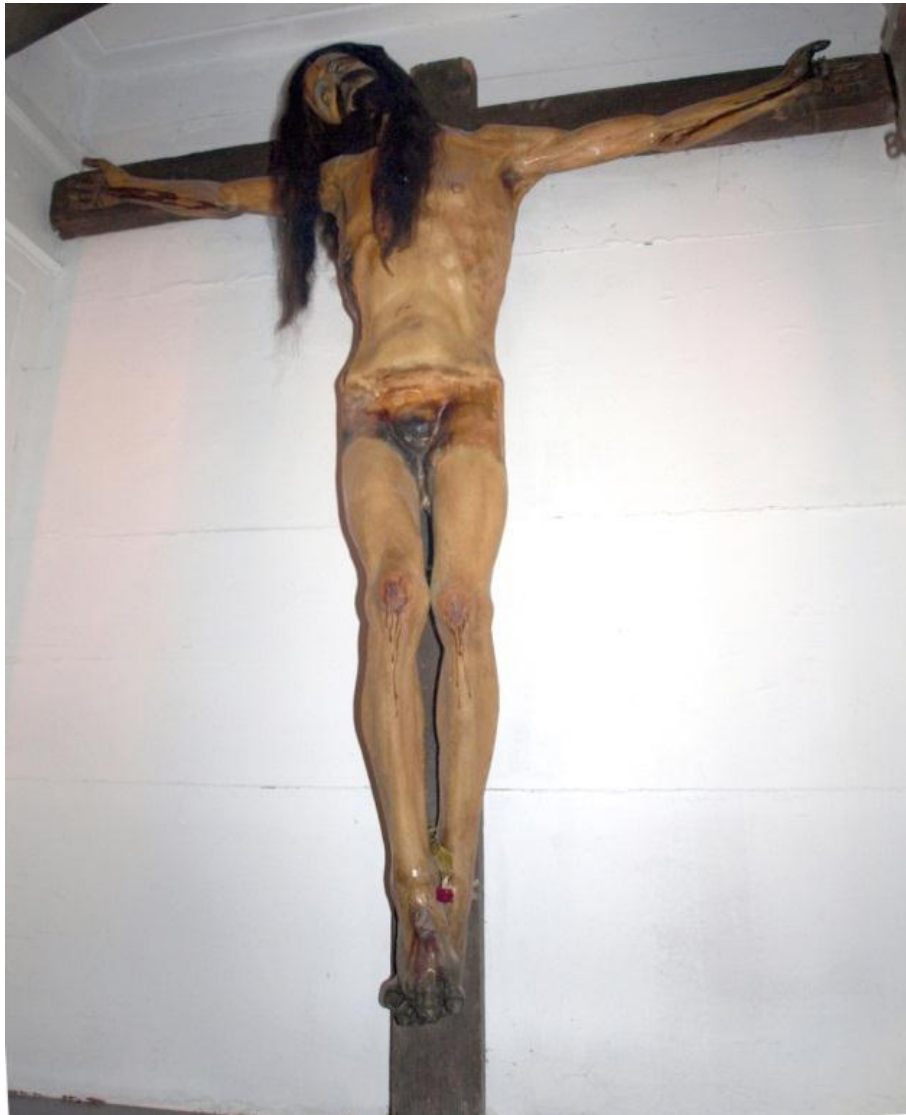
Figura 8. Aspecto del Santo Cristo del Otero sin faldellín, marcas dejadas por el sistema constructivo con tela encolada.

El Santo Cristo del Otero es prácticamente idéntico al Cristo de la Misericordia , y muy similar a los otros de Villaquejida, Sahagún y Salamanca, a pesar de las transformaciones que ha sufrido a lo largo de su historia como el embotamiento y difuminado de detalles por superposición de estratos de policromía, o la pérdida del perizonium.