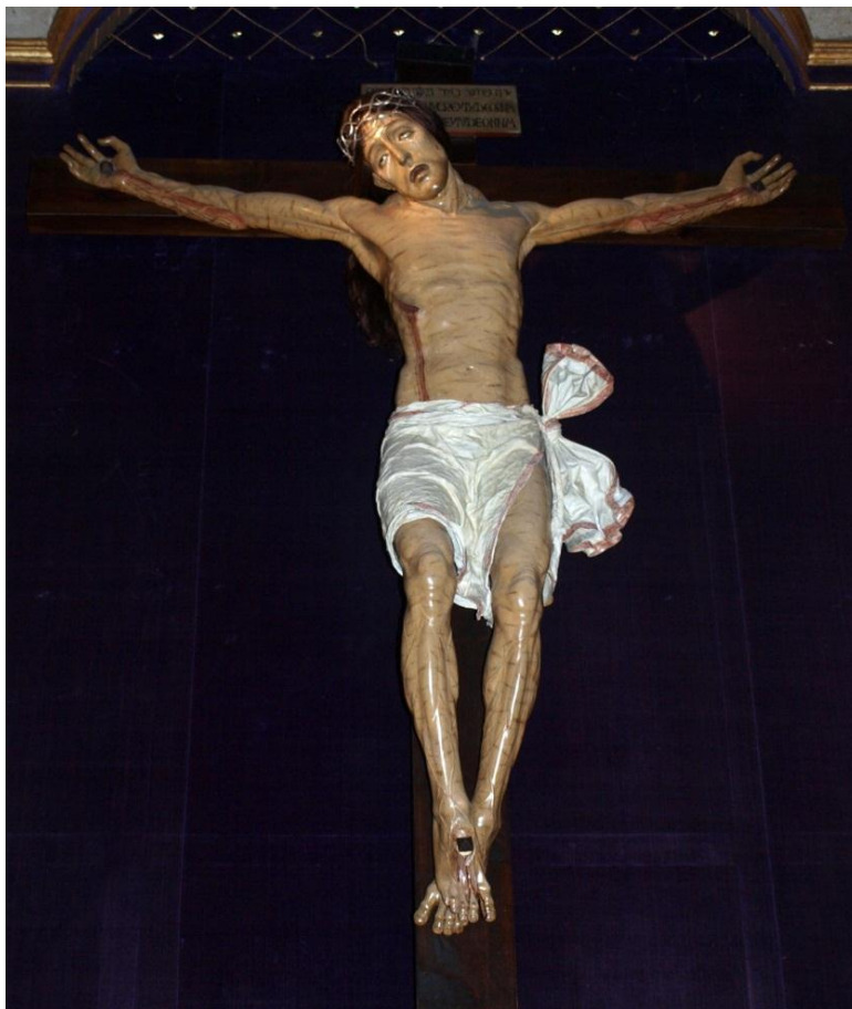
Figura 1. Cristo de la Agonía Redentora (175 x 165 x 35cm) Catedral Nueva, Salamanca

seda, por su parecido formal con otros crucificados de este autor, y cronológicamente lo sitúa en torno a 1525.