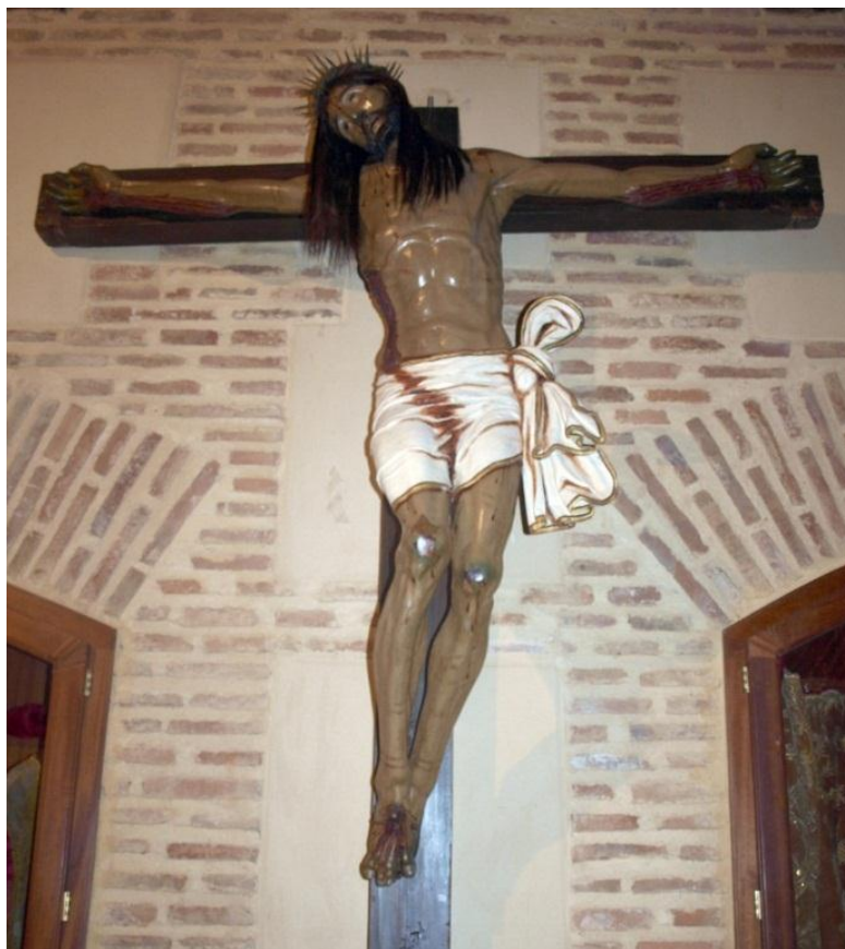
Figura 5. Cristo de la Agonía (170 x 168 x 38cm) Museo del Monasterio de Santa Cruz de las Madres Benedictinas, Sahagún de Campos (León).

Todo indica que el Cristo de la Agonía es de comienzos del siglo XVI, y sus características formales coinciden con las de los otros cristos en un alto porcentaje, pero con leves diferencias debidas a una intervención en época barroca, cuando se cubrió la policromía original aplicando la actual más oscura y embotando detalles de la talla, pero que no ocultaron las características que denotan su primitivismo.