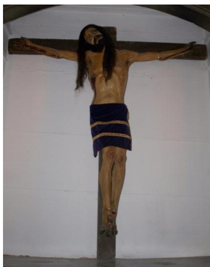
Figura 7. Santo Cristo del Otero (163 x 153 x 30cm) Ermita del Otero, Palencia.