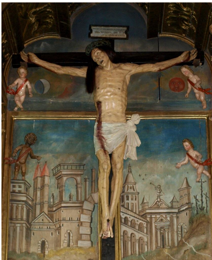
Figura 3. Bendito Cristo de Villaquejida (172 x 164 x 34cm) Iglesia del Santo Cristo y de Santa María de las Heras, Villaquejida (León).

Redentora, pero peor conservada, a pesar de la restauración de 2007 9 . No presenta tantas marcas de tormento, ni el peleteado ni las lágrimas blanquecinas en los ojos de aquel. Los regueros de sangre son algo más abundantes con gotas que discurren serpenteantes, y la herida del costado es muy similar. La cabeza también es lisa y redonda, pensada probablemente para recibir peluca. Ésta se ciñe a la cabeza con una corona de espinas independiente tallada en madera, abultada, de tallos gruesos trenzados regularmente, que en algunas partes son prismáticos, y con espinas gruesas que siguen la dirección del trenzado. Esta corona está policromada en verde oscuro, y es muy parecida a la que presenta el crucificado del calvario del retablo mayor de la Catedral de Palencia, de Juan de Balmaseda. Al ser un elemento independiente, se podría extrapolar que la imagen fue hecha para tener peluca desde el principio, al igual que la barba de cabello natural, de la que carece en la actualidad y que no ha sido reintegrada en la reciente restauración. En las fotografías antes de la intervención (Parrado 1979: 151) se aprecian manchas blanquecinas y oscuras donde se ubicaría la barba, consecuencia de la degradación del adhesivo empleado para la sujeción de ésta sobre la policromía.