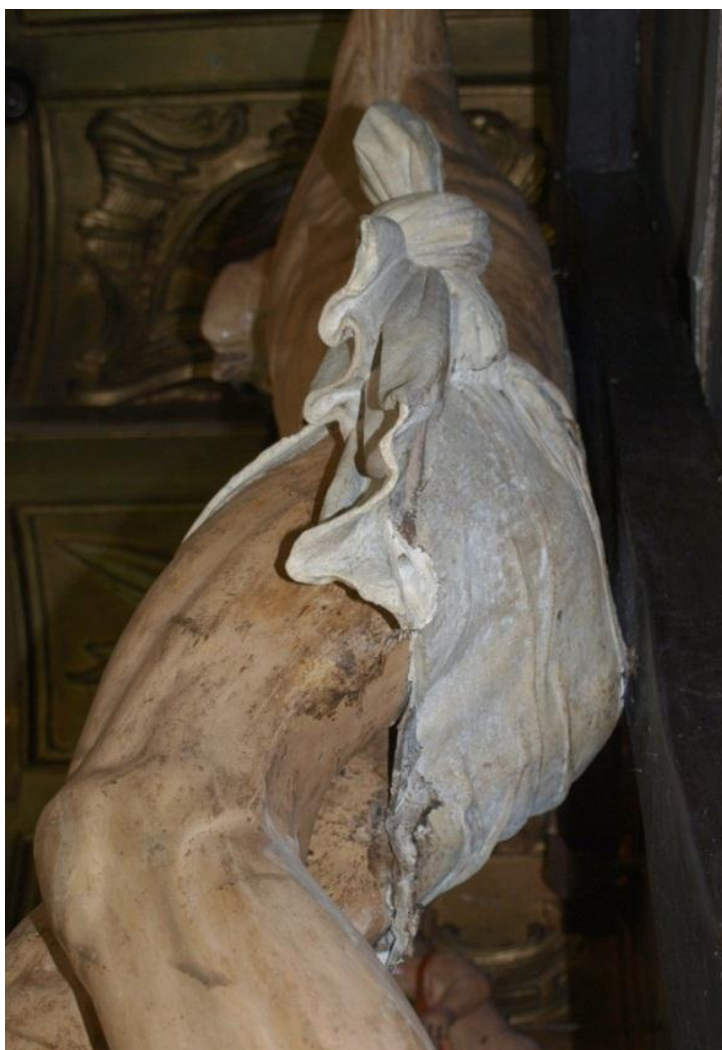
Figura 4. Detalle del perizonium del Bendito Cristo de Villaquejida. Encuentro entre la tela encolada y el lazo tallado en madera. Se aprecia madera sin policromar bajo la tela encolada despegada del muslo.

El perizonium del Cristo de Villaquejida está formado por una banda de tela encolada que cubre la cintura y los muslos hasta la mitad, con drapeado sencillo y aspecto de tela mojada pegada al cuerpo, de pliegues finos, horizontales y diagonales que concurren en el lazo tallado en madera anudado a su izquierda, cuyos extremos sobrantes cuelgan ordenada y escalonadamente con pliegues delgados, repetidos y paralelos. En la parte inferior tiene ondulaciones y quiebros angulosos como movidos por el viento. Se adosa al resto del perizonium continuando los pliegues formados en tela encolada. El tejido de la tela encolada es tafetán delgado de lino, de trama cerrada y densa que no se deja apreciar a través de la policromía en temple 10 blanco y sin motivos decorativos que la recubre. En la parte posterior la tela encolada presenta los bordes parcialmente quemados, y están ligeramente despegados de los muslos dejando ver la madera sin policromar. Este hecho facilita la reconstrucción del proceso de elaboración. La tela encolada se aplica sobre la talla y luego se policroma toda la escultura conjuntamente, apreciándose en el detalle del borde de la tela encolada sobre el que se monta ligeramente la carnación siendo ésta la última capa en aplicarse, de tal manera que el blanco del perizonium podría corresponder a una capa de preparación aplicada a toda la escultura y dejada “en reserva” como color del tejido.