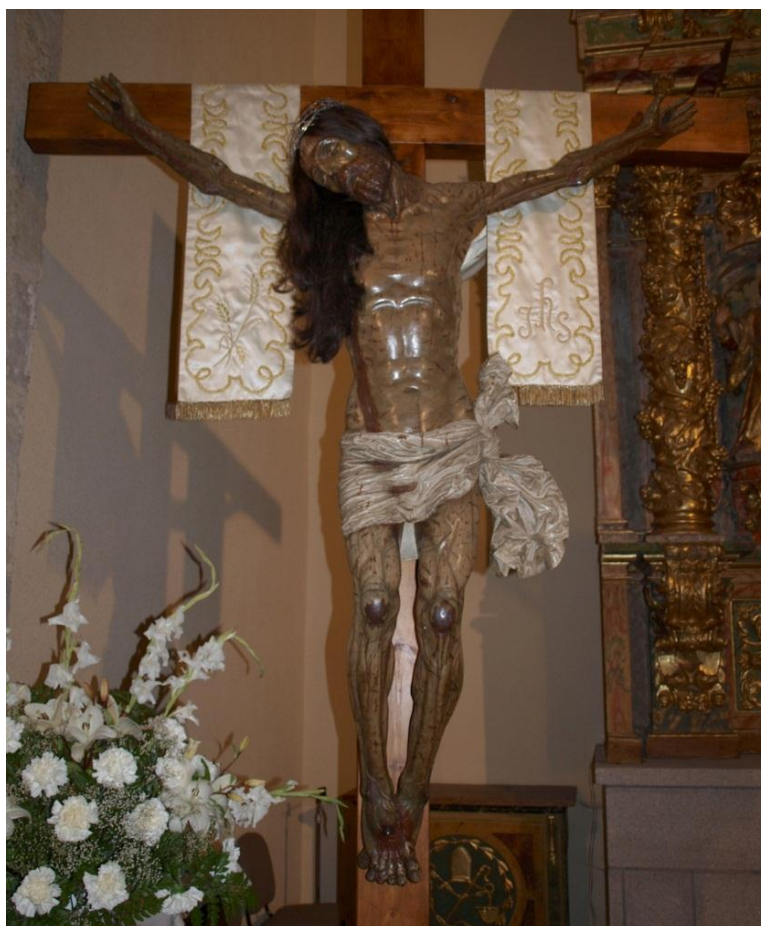
Figura 2: Cristo de la Salud o de San Leonardo (178 x 168 x 35cm) Iglesia de San Pedro, Alba de Tormes (Salamanca).

mantina, incluso en las lágrimas blancas, salvo porque se encuentra algo oscurecida por la suciedad y barnices. Su deuda estilística con la escultura alemana y flamenca de finales del siglo XV y principios del XVI es patente 8 . Siendo ambas obras excepcionales, el Cristo de la Salud puede haber servido de modelo para el de la Agonía Redentora , pues es superior escultóricamente, y según Gómez Moreno, anterior en el tiempo –siglo XV-, y quizá también modelo para los demás cristos que analizamos en el presente artículo.