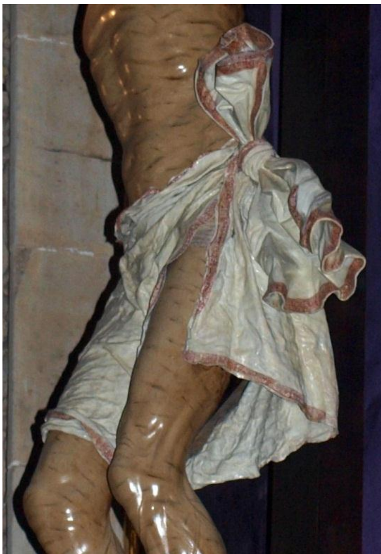
Figura 10. Coexistencia de tela encolada y de drapeado tallado en madera en el perizonium del Cristo de la Agonía Redentora.

Cristo exacerbada, acercándolo al aquí y al ahora. Y entre ambas soluciones plásticas se encuentran los perizonios del Cristo de la Agonía Redentora , el Bendito Cristo de Villaquejada , el Cristo de la Agonía y el Santo Cristo del Otero , donde se optó por realizar el paño de pureza en tela encolada en un intento de acercamiento y de humanización –junto al empleo de cabello natural y de barba postiza–, mientras que el lazo anudado se realizó en madera tallada, para contrarrestar un exceso de humanización y por contraste mantener un cierto grado de idealización y eternidad en la representación sagrada.