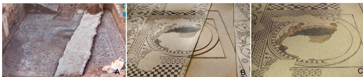
Figura 9. Pavimento de mosaico. A. El mosaico in situ antes de proceder a su extracción. B. Tras su restauración el pavimento se ubica en una de las salas del museo. Colocación de los listones con gravilla negra adherida para dibujar las principales líneas decorativas perdidas. C. Detalle de la zona central tras colocar la gravilla suelta.

El primer paso fue la sujeción a la estructura de unos finos listones de madera cortados a medida, que se adaptaron a las formas del dibujo decorativo central que deseábamos completar [Figura 9]. Sobre estos se colocó gravilla de color negro adherida con resina epoxídica, convirtiéndose en los únicos puntos fijos de todo el sistema. Definidos así los espacios, solo quedaba completar el relleno de la laguna colocando en el resto de la superficie una mezcla de gravillas sueltas de color negro y marfil en una proporción 1:7, que ofrecía una vibración, textura y tonalidad muy armónica con el original. El mismo material fue colocado en otras lagunas más pequeñas que también presentaba el pavimento. Una de ellas correspondía a una zona de quemado donde se emplearon hasta tres colores diferentes de gravillas para entonarlo con el color de la piedra original. En cualquier caso es una alternativa rica de posibilidades, que permite obtener resultados estéticos muy buenos con recursos muy sencillos [Figura 10].