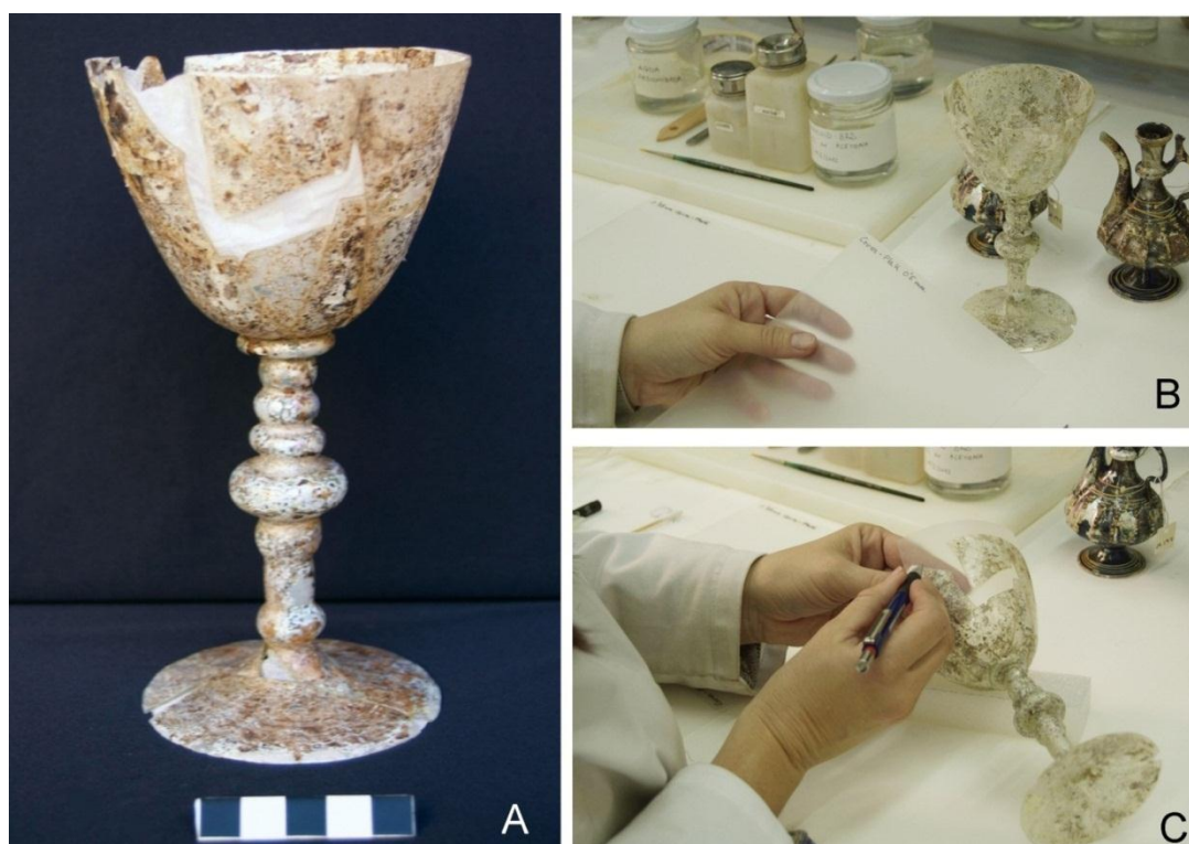
Figura 7. Cáliz de vidrio. A. Fotografía antes de la intervención, donde observamos los refuerzos de papel adheridos a la pieza. B. Selección de la lámina de PP de 0'5 mm. C. Colocación de la lámina de PP en el interior de la laguna y perfilado a mano del contorno.