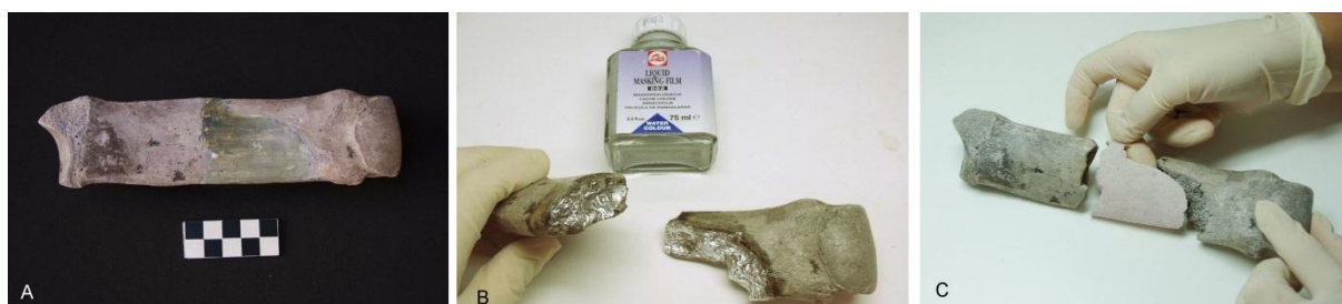
Figura 5. Metapodio central de rinoceronte. A. Fotografía de la pieza antes de la intervención, donde observamos la antigua reintegración de escayola pintada. B. Protección de las superficies de contacto. C. Realización de la reintegración desmontable con masilla sintética Balsite.