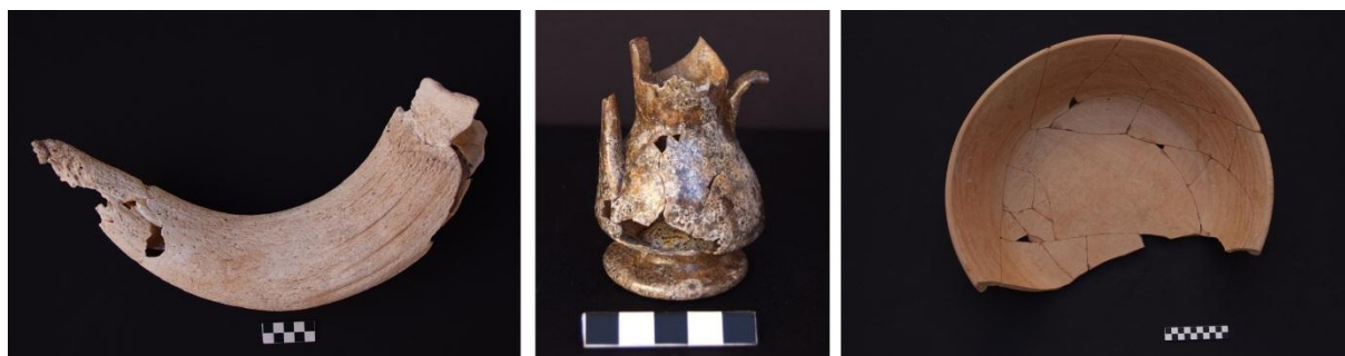
Figura 1. La alternativa de la no-reintegración en materiales de procedencia arqueológica.

El criterio de mínima intervención aplicado a la conservación de nuestro patrimonio arqueológico debería de imponerse de forma más efectiva y aplicarse en todos aquellos casos donde la comprensión del objeto o su estabilidad no queden menoscabadas [Figura 1]. Nuestra experiencia laboral nos dicta que son muchas las ocasiones en donde no se precisa de un relleno de lagunas para que la legibilidad de la obra sea correcta, más aun en la era en la que estamos inmersos, donde las alternativas de reconstrucción digital son numerosas (Escriba y Madrid 2009-2010; Kotoula 2011). Quizás el problema esté más en nuestra propia mentalidad, habituada por una tradición artística de peso a que nos faciliten el trabajo visual con una intervención directa. Hoy en día, desde nuestra profesión se comprende que actuar desde el respeto al principio de mínima intervención no significa estar anulando la capacidad de la correcta difusión y comprensión de una obra, sino que implica ser consciente del daño que cualquier tratamiento directo supone para la pieza y buscar alternativas que lo aminoren o lo eviten. Nuestra responsabilidad ahora es hacer partícipes de estas ideas a otros profesionales en particular y a la sociedad en general, en definitiva a aquéllos que son cómplices de nuestras decisiones y espectadores de las colecciones.