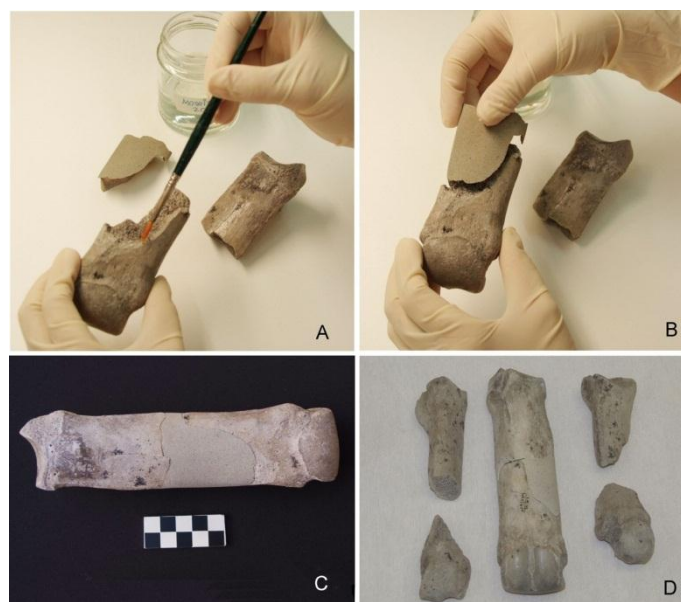
Figura 6. Metapodio central de rinoceronte. A. Colocación de puntos de adhesivo en la zona compacta. B. Adhesión de la reintegración desmontable. C. El metapodio después de la intervención. D. Conjunto anatómico de los huesos del rinoceronte expuestos en sala.