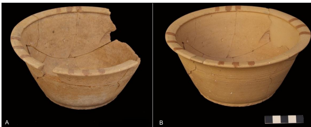
Figura 4. Lebrillo cerámico. A. Fotografía antes de la intervención B. Fotografía después de la intervención.