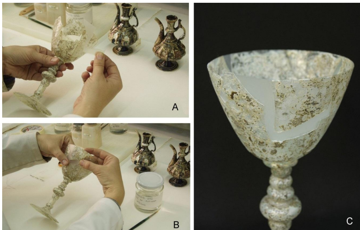
Figura 8. Cáliz de vidrio. A. El fragmento desmontable ya recortado con bisturí. B. Adhesión de la lámina de PP en el interior de la laguna con Paraloid B72. C. Detalle de la pieza con la nueva zona reconstruida.

El primer paso fue la sujeción a la estructura de unos finos listones de madera cortados a medida, que se adaptaron a las formas del dibujo decorativo central que deseábamos completar [Figura 9]. Sobre estos se colocó gravilla de color negro adherida con resina epoxídica, convirtiéndose en los únicos puntos fijos de todo el sistema. Definidos así los espacios, solo quedaba completar el relleno de la laguna colocando en el resto de la superficie una mezcla de gravillas sueltas de color negro y marfil en una proporción 1:7, que ofrecía una vibración, textura y tonalidad muy armónica con el original. El mismo material fue colocado en otras lagunas más pequeñas que también presentaba el pavimento. Una de ellas correspondía a una zona de quemado donde se emplearon hasta tres colores diferentes de gravillas para entonarlo con el color de la piedra original. En cualquier caso es una alternativa rica de posibilidades, que permite obtener resultados estéticos muy buenos con recursos muy sencillos [Figura 10].