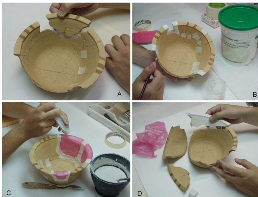
Figura 2. Lebrillo cerámico. Fases del proceso de construcción de las reintegraciones desmontables: A. Montaje provisional en grupos. B. Colocación de la capa intermedia de látex. C. Vertido de la escayola sobre los moldes de cera. D. Separación de las reintegraciones tras el fraguado de la escayola.