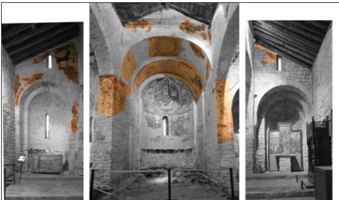
Fragmentos de pintura románica original existentes en la iglesia de Sant Climent de Taüll.

El proyecto de conservación-restauración intervendrá sobre las pinturas murales originales aún existentes en la zona del ábside de la iglesia de Sant Climent. Estas pinturas están situadas bajo la reproducción que se ha expuesto hasta ahora y los restos de decoración situados en el pie de los muros laterales del presbiterio. Las capas que ahora se recuperarán constituyen un hallazgo excepcional que permitirá relacionar directamente la pintura con el entorno arquitectónico, situar correctamente las pinturas arrancadas y determinar la composición de los morteros originales.