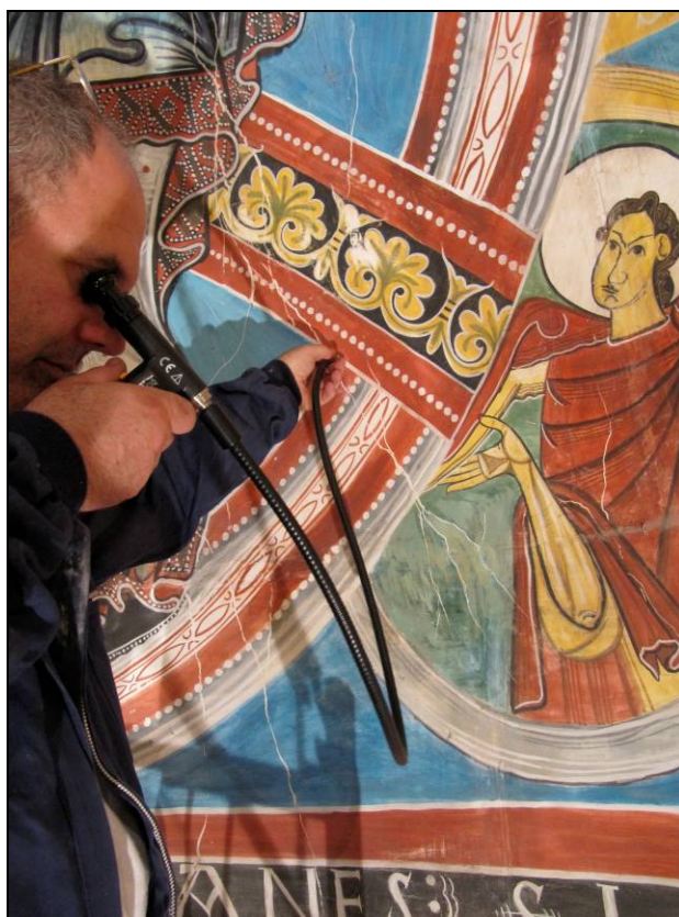
Sondajes detrás de la copia de los años 60.

A fin de alcanzar dichos objetivos, se retirará previamente la reproducción de las pinturas murales del ábside, obra del artista Ramon Millet que fue realizada e instalada en la iglesia a principios de la década de 1960. Se trata de una estructura de varios paneles de madera y yeso, pintada y muy degradada, colocada encima del muro antiguo con restos pictóricos románicos de modo que impide su observación. Una vez retirada, será conservada por su valor documental.