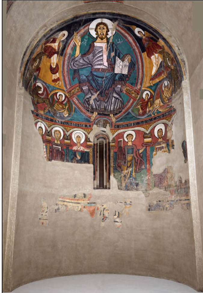
Las pinturas del ábside de Sant Climent de Taüll en el MNAC.

Las pinturas del ábside fueron arrancadas de su emplazamiento original y trasladadas a Barcelona en el año 1920. En la actualidad las partes más conocidas pueden contemplarse en el MNAC, mientras que algunos fragmentos descubiertos y restaurados en 2000 y 2001 se conservan en su ubicación original como la escena de Caín y Abel o la figura de Sant Climent.