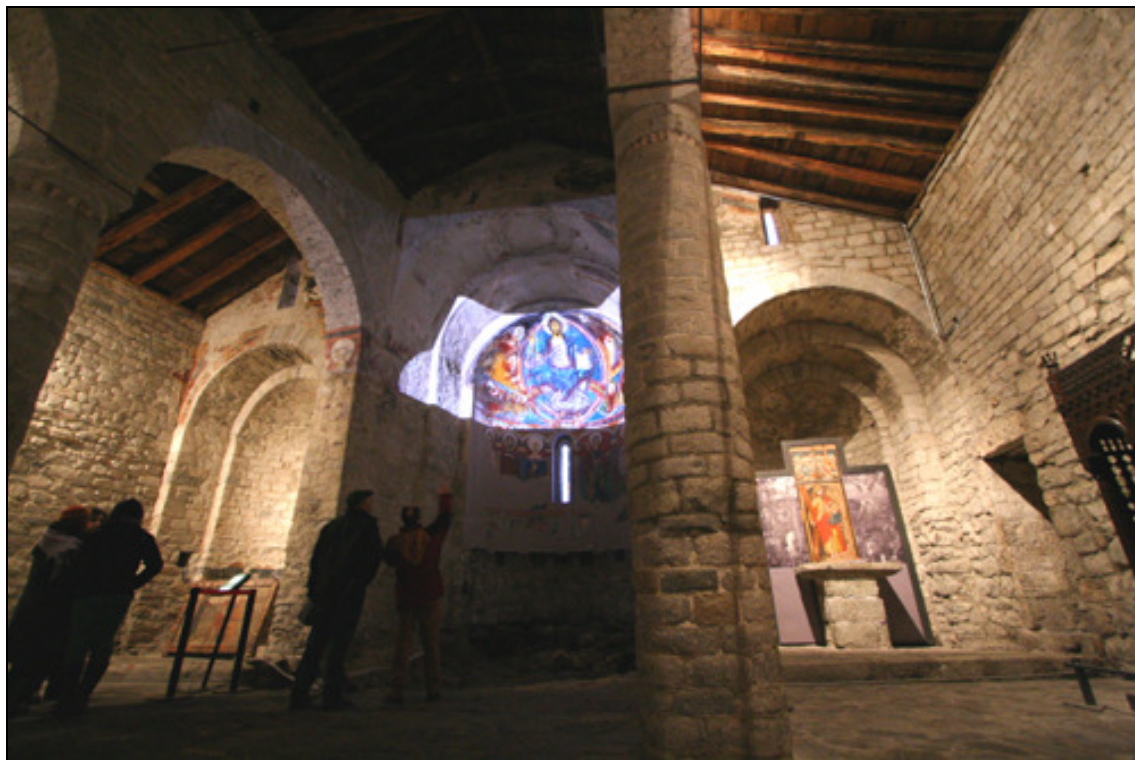
Pruebas de proyección en Sant Climent de Taüll.

La presentación de estos estadios se realizará de forma cronológica, de modo que mostrará dos conceptos capitales de la pintura: su proceso y su significado.