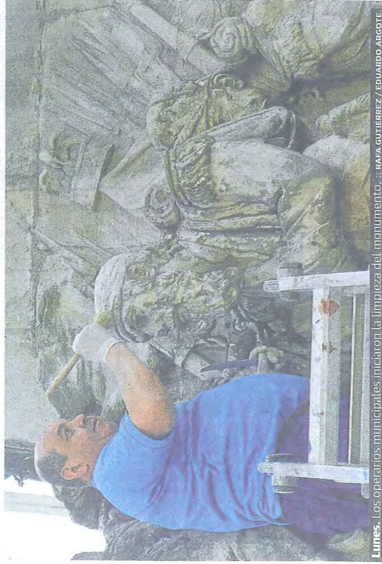
Lunes. Los operarios municipales iniciaron la limpieza del monumento.