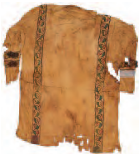
Túnica còpia. Museu de Montserrat.

Els Teixits han acompanyat a l'ésser humà al llarg de tota la Història, des de les seves èpoques més remotes fins als nostres dies. L'home i la dona van aprendre a filar i teixir quan van ser capaços de solucionar de manera intel·ligent la seva necessitat d'abrigar-se i de cobrir-se. Però molt aviat, a més d'aquesta funció utilitària, el teixit va ocupar altres funcions més complexes i va anar adquirint un component simbòlic i social per a expressar identitats ja fossin individuals o col·lectives, familiars o socials, fins al punt que el vestit o la indumentària es va convertir en un element destacat i característic de cada cultura de Món Antic. Paral·lelament, l'evolució de l'arquitectura i l'urbanisme comportava l'adequació de les produccions tèxtils a les funcions ornamentals, senyalitzadores i delimitadores d'espais que aquesta requeria. Aquest fet explica el creixent interès de la investigació moderna per conèixer en profunditat els teixits de la Mediterrània antiga. El nostre coneixement sobre ells es beneficia de nombrosos avenços tècnics i metodològics al llarg de les darreres dècades, que han permès avenços certament significatius en moltes de les mencionades línies d'investigació, de la qual cosa dona bona mostra el programa d'aquestes VI Jornades Universitàries.