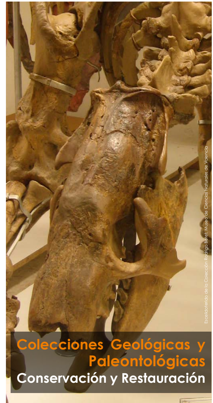
Escudoterido de la Colección Rodrigo Boret. Museo de Ciencias Naturales de Valencia