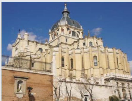
Cripta y Catedral de Santa María la Real de La Almdena (Madrid), construida con materiales pétreos naturales.