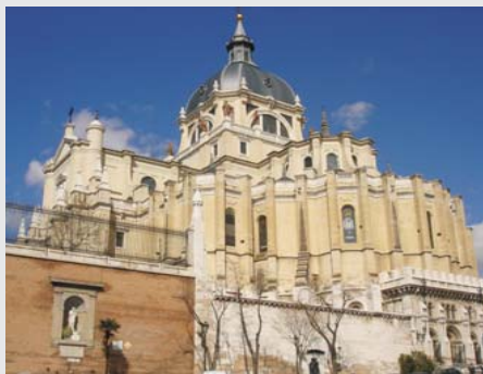
Cripta y Catedral de Santa María la Real de La Almdena (Madrid), construida con materiales pétreos naturales.