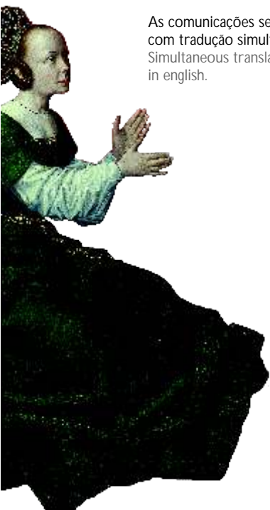
Políptico da Vida da Virgem. Museu de Évora Fotografias: José Pessoa Data: 2009 Documentação Fotográfica INSTITUTO DOS MUSEUS E DA CONSERVAÇÃO, I.P.

As comunicações serão proferidas em português e inglês, com tradução simultânea. Simultaneous translation will be provided in portuguese and in english.