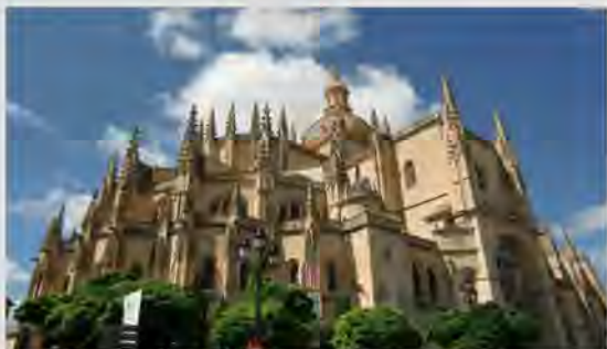
Catedral de Segovia, construida con materiales pétreos naturales.