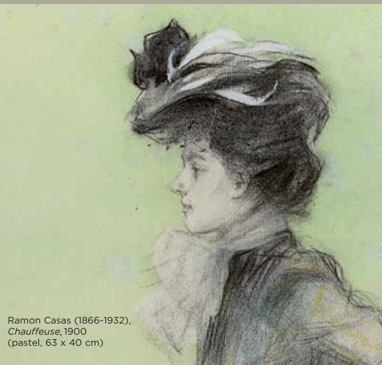
Ramon Casas (1866-1932), Chauffeuse , 1900 (pastel, 63 x 40 cm)