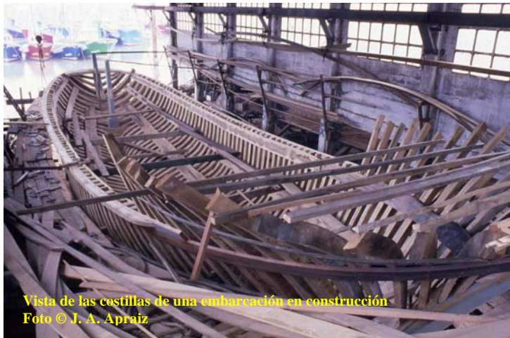
Vista de las costillas de una embarcación en construcción