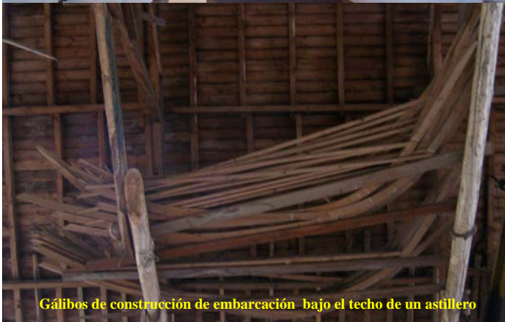
Gálibos de construcción de embarcación bajo el techo de un astillero