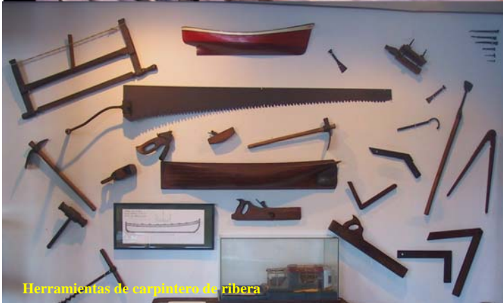
Herramientas de carpintero de ribera