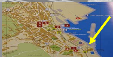
Plano de localización de la Escuela de Náutica