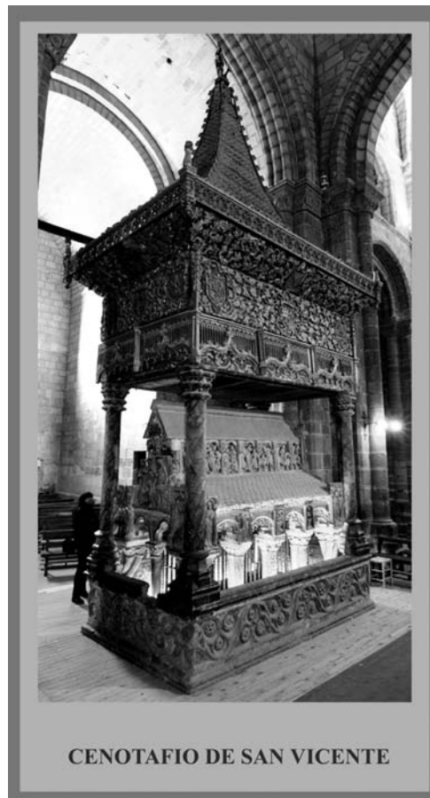
Fig.1: Cenotafio de San Vicente