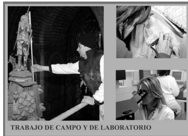
Fig.2: Trabajo de campo y de laboratorio