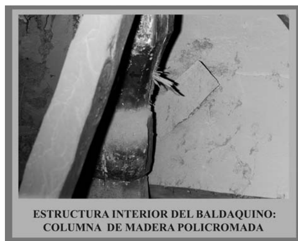
Fig.4: Estructura interior del baldaquino: columna de madera policromada