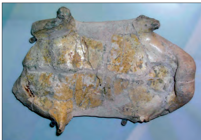
Fig. 2. Ejemplo de reintegración realizada sin criterios, con objeto de unir las piezas entre sí sobre un peto de Testudo catalaunica .