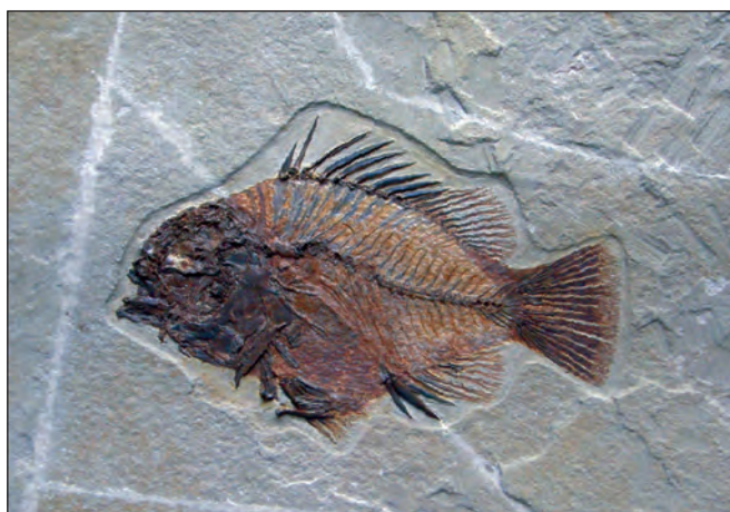
Fig. 6. Reintegración con estuco en zona de fracturas y alteración cromática de la misma por desvanecimiento del pigmento en el pez fósil del género Priscacara .