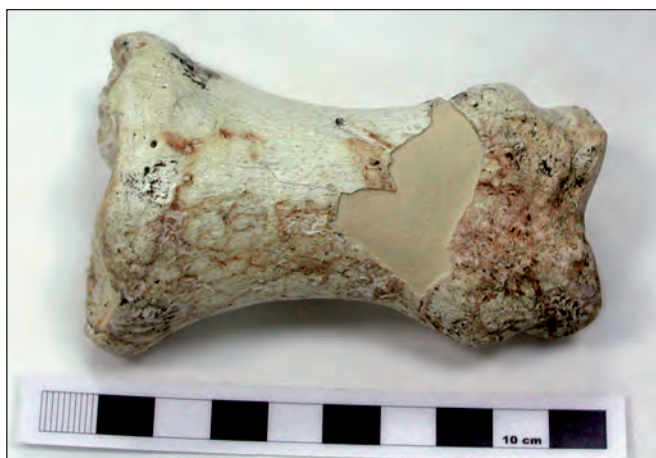
Fig. 4. Copia de falange de Equus major con reintegración mediante tinta plana a bajo nivel.