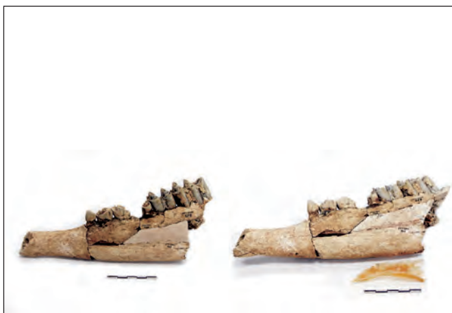
Fig. 1. Ejemplo de reintegración reversible en una hemimandíbula de Leptobos etruscus y colocación de un fragmento aparecido con posterioridad.