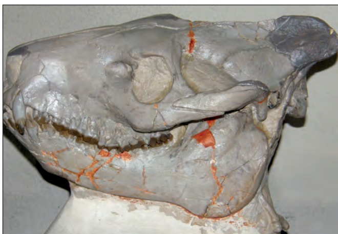
Fig. 3. Cráneo de Eporeodon major en el que pueden observarse cambios notables en la reintegración cromática.