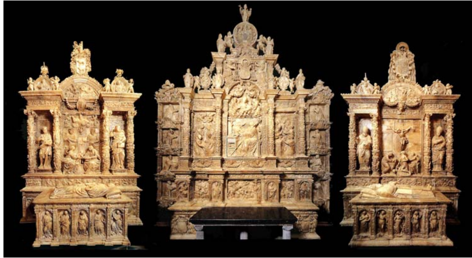
Figura 3: Retablos de la capilla de San Bernardo, la Seo de Zaragoza.