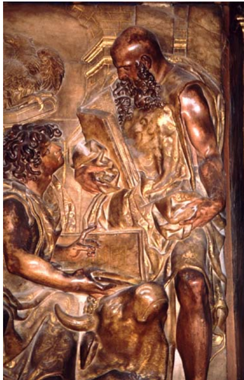
Figura 4: San Juan Evangelista y San Lucas (detalle), retablo de la capilla de Gabriel Zaporta, la