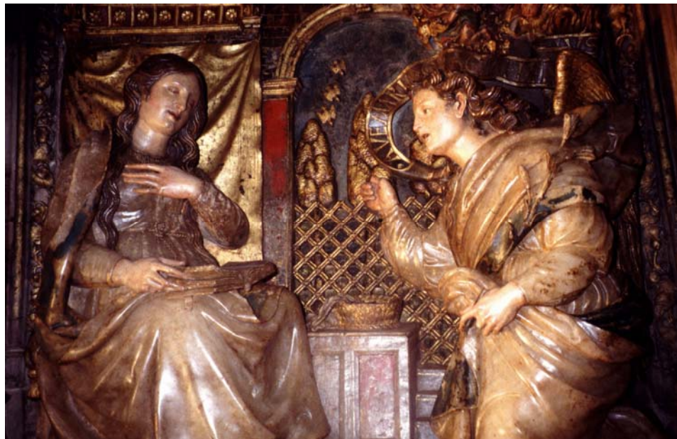
Figura 2: Anunciación (detalle). Retablo Mayor del Pilar de Zaragoza.